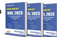
Criminal Major Laws Linking Bare Acts